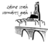
Katholische Pfarreiseelsorge Freiburg Stadt und Umgebung